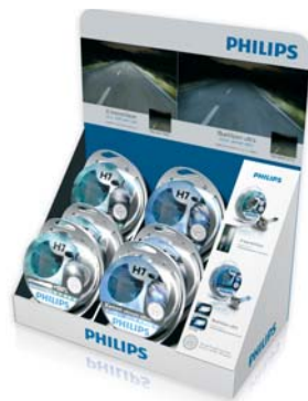
Expositores para X-tremeVision / BlueVision ultra