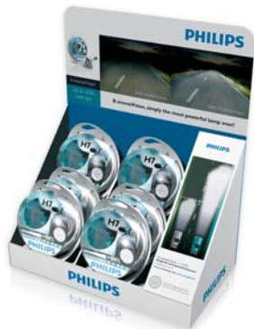
Expositores para X-tremeVision